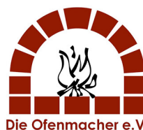
Die Ofenmacher e.V.